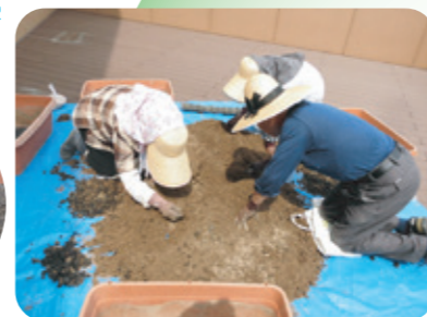
5月末、東病棟のプランターに苗を植えました。