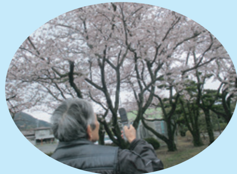
携帯カメラでパシャ！きれいな桜をいつまでも…。