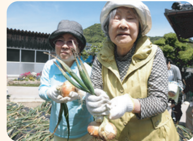
なかよしツーショットで「大きい玉ねぎとれたよー」