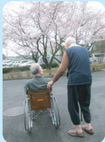
花を眺めながら男同士の語らい。

松恒園の男性入所者さん。女性と比べると人数は圧倒的に少ないのですが、それでも皆さん悠々自適に過ごされています。みんな優しく、みんな仲良し！そんな松恒園男性陣の日々の様子をお伝えします。