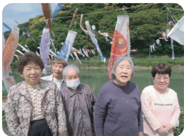
たくさんのおいのぼりをバックにみんな揃って記念撮影！