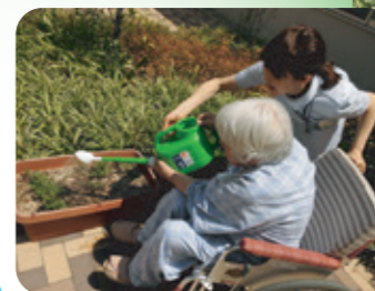
看護師さんと水をあげます。「大きくなってね♪」