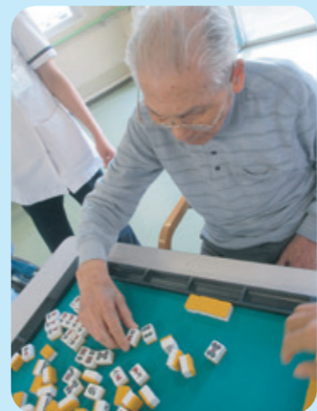
麻雀牌の感触、音、ワクワクするね！