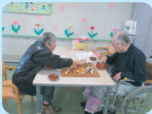
松恒園名人戦…勝つのはどっち！？