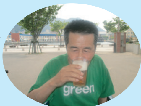
外出レクで一杯♪ノンアルコールですが、「あー、うまい！！」

松恒園の男性入所者さん。女性と比べると人数は圧倒的に少ないのですが、それでも皆さん悠々自適に過ごされています。みんな優しく、みんな仲良し！そんな松恒園男性陣の日々の様子をお伝えします。