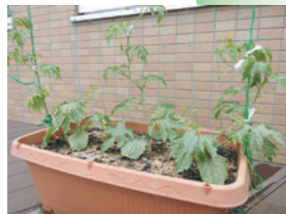
6月中旬、ちょっと成長！

昨年同様ベランダでゴーヤを栽培します。ネットをつたって成長すれば、緑の美しいカーテンが出来上がります♪