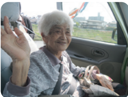
「天気も良くて、気持ちがいいねー！」笑顔の一枚です！

今回のドライブは小倉南区桜橋へ。橋から紫川上流を眺めると、約400匹のおいのぼりが青空の下、優雅に泳いでいます。その雄大な景色をみんな楽しんでました。