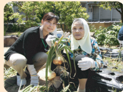
初夏の日差しに負けない気合い！タオルを巻いて、がんばりました！

松恒園入所、和ごころの利用者さん、そしてひだまりキッズが集まって、すすすす育った玉ねぎを収穫しました。畑のあちこちから喜びの声が聞こえ、ちびっ子世代、利用者さん世代の楽しい交流が出来ました。