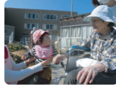
ひだまりキッズが大活躍！畑を掘りつつ、高齢者のみなさまに癒しを届ける、大忙しな一日でした。