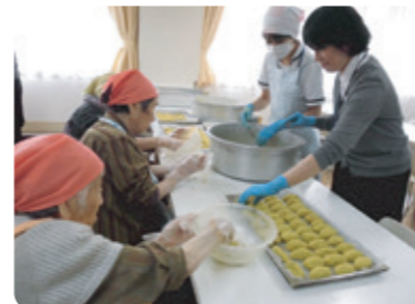
収穫したおいもは、松恒園文化祭の前日、調理しました。