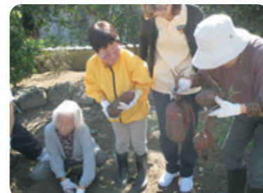
「おおいのとれたね！」 「こっちはたくさんよ!!」

10月25日、快晴の空の下、和「ころ」畑にてさつまいもの収穫を行いました。松恒園入所者さん、和「ころ」利用者さん、たなごころ入居者さん、そしてひだまりキッズが集いました。軍手を履いて、準備はバッチリ！さて、掘りはじめると、あちこちから立派なおいもが顔を出します。「たくさん採れてよかったですね。」大地の恵みに感謝、感謝の畑活動となりました。