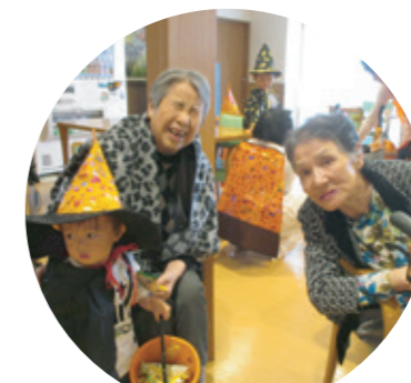
キッズの仮装に大喜びの利用者さん。「お菓子をどうぞ♪」