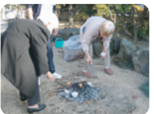
秋の美味をいただく、その過程も楽しみのひとつです。

この秋の和「ころ」活動をご案内。お出かけレクに秋刀魚、干し柿、焼き芋と、秋の味覚をいただく企画に、みんなで楽しく取り組みました。