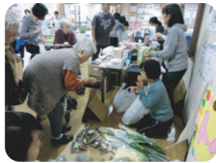
バザーは開店から大盛況。大特価採れたて野菜も完売です！