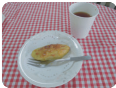
みんなの思いが詰まった美味しいスイーツです♪