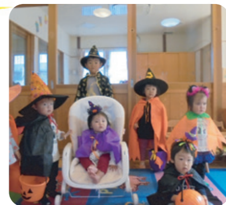
ハロウィンコーディネートはバッチリです！みんな揃ってはい、チーズ♪

10月31日はハロウィン！この日はひだまりキッズが仮装をして法人内各施設を訪問。待つていた利用者さんたちは、かわいいゲストにお菓子を配って大喜びです。ひだまりキッズもバケツいっぱいのお菓子に笑顔、笑顔！。鳥巣病院ではアンパンマンもやって来て、ハロウィンを盛り上げてくれました♪