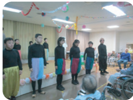
劇団パパカンパニーさんが来園。独自の世界観を披露してくれました。