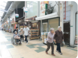
馴染みのある商店街へお出かけ！優しい店員さんとも仲良くなりました♪