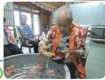
カラフル醤油入れを金魚に見立て、「すくうぞー！」

夏といえば…いろいろありますが、和ごころの夏はこの「和涼会」です。今年もみんな法被を羽織って、和ごころ風にアレンジした夏ならではの遊びを楽しみました。童心に返って、みんなでワイワイ♪昔ながらの和の夏を堪能しました。