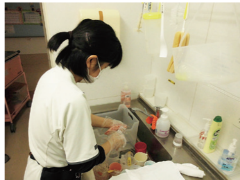
先輩Aさんの仕事は丁寧、的確。鳥巢病院になくてはならない存在です。

「社会の一員として頑張りたい」という二人のひたむきな気持ちで、病棟職員の支援の輪をより強いのにしてあります。障害のある方も安心して働ける環境づくりをこれからも考えていきます。