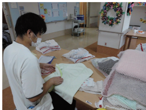
後輩Bさんもまじめで一生懸命。既に貴重な戦力になっています!