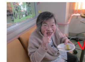
VERY GOOD! おいしいよー！