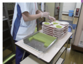
冷やしてカット！ みなさんにお届けします♪