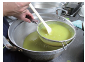
丁寧にこしています！